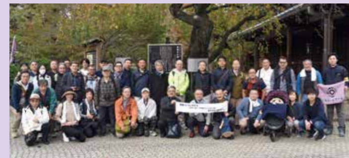
参加された皆様「豪徳寺」で集合写真を撮影!