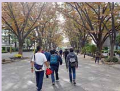
東京農大「食と農」の博物館・けやき広場